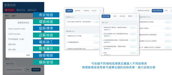
可依據不同場域或場景定義區入不同巡檢表 現場督導或使用者可選擇合適的巡檢表單，進行巡檢任務